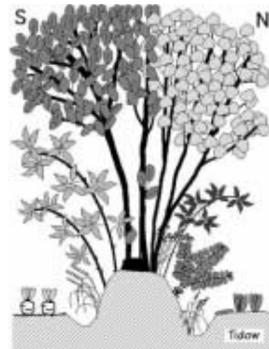
Querschnitt durch einen Knick

Holz als traditioneller, kostengünstiger und umweltfreundlicher Einsatzstoff verbrennt nahezu CO 2 -neutral, da der im Holz gebundene Kohlenstoff aus dem CO 2 der Luft stammt. Holz ist ein nachwachsender Rohstoff. Sein Einsatz schützt die Gas- und Ölressourcen.